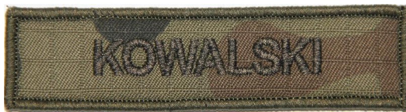
Rysunek 1 – Oznaka identyfikacyjna z nazwiskiem do ubioru polowego Wzór 133A/MON