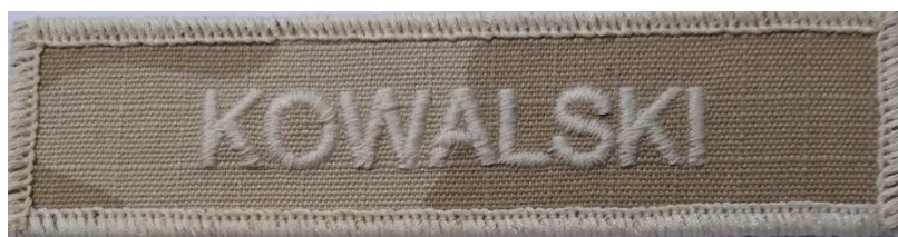
Rysunek 2 – Oznaka identyfikacyjna z nazwiskiem do ubioru polowego tropikalnego Wzór 133PA/MON