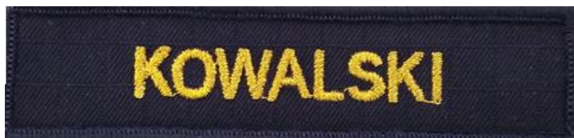
Rysunek 3 – Oznaka identyfikacyjna z nazwiskiem do ubioru ćwiczebnego wzór 133MW/MON